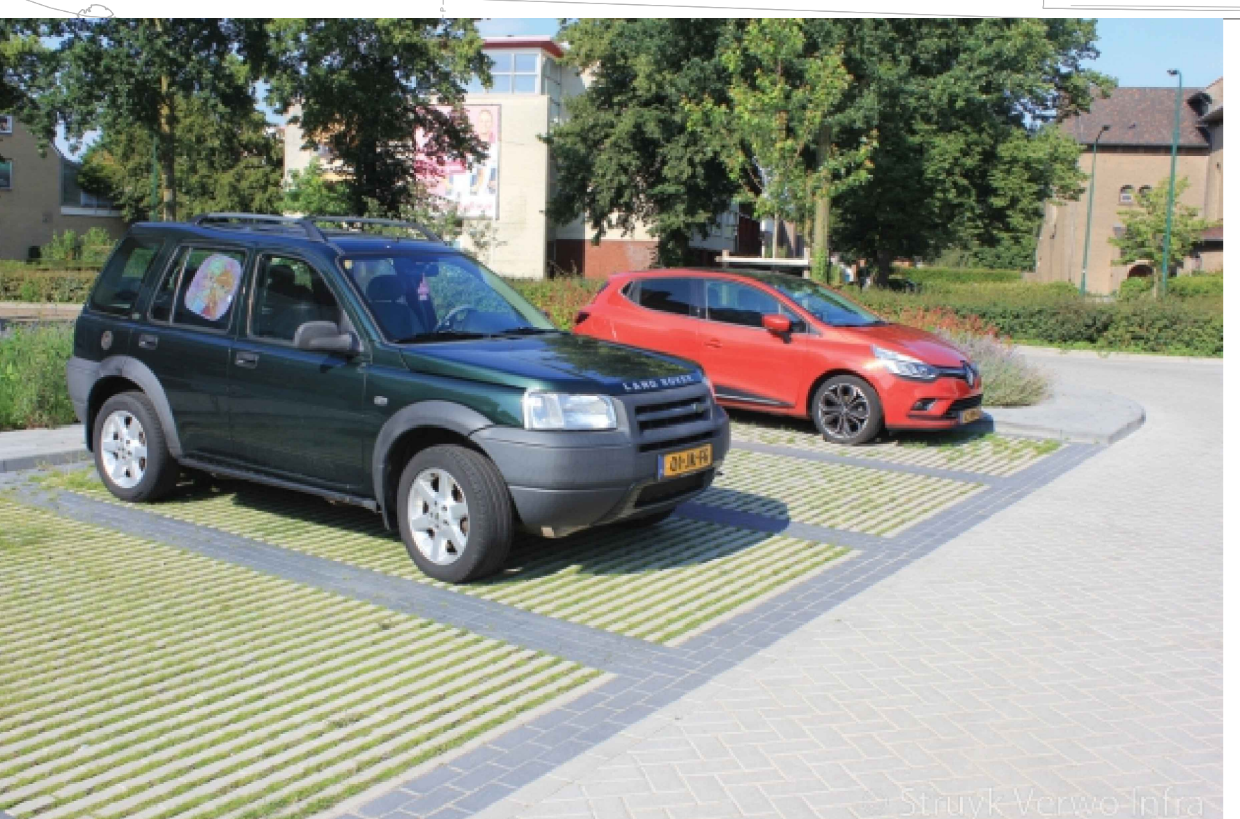
Voorbeelden van groene verharding: